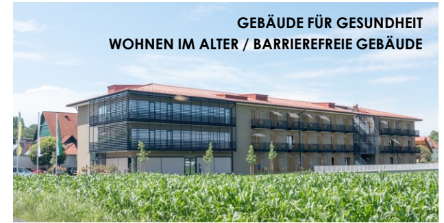
GEBÄUDE FÜR GESUNDHEIT WOHNEN IM ALTER / BARRIEREFREIE GEBÄUDE