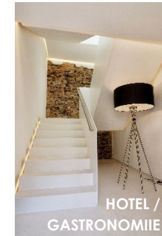
HOTEL / GASTRONOMIE