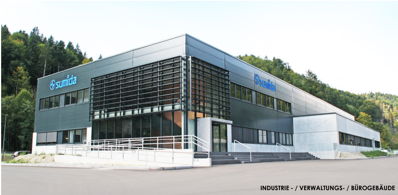
INDUSTRIE - / VERWALTUNGS- / BÜROGEBÄUDE