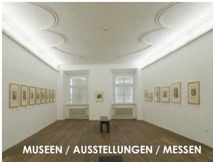
MUSEEN / AUSSTELLUNGEN / MESSEN