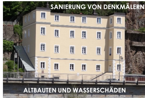
SANIERUNG VON DENKMÄLERN