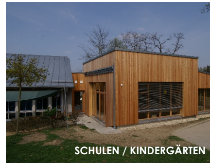
SCHULEN / KINDERGÄRTEN